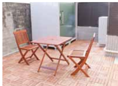
中庭では安全に遊べます