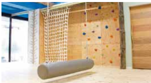
明るくて開放感のある空間