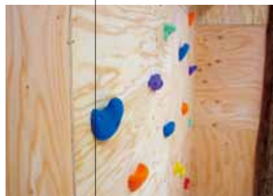
五感をマッチングする色たち